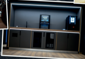
Heiß- und Kaltgetränke