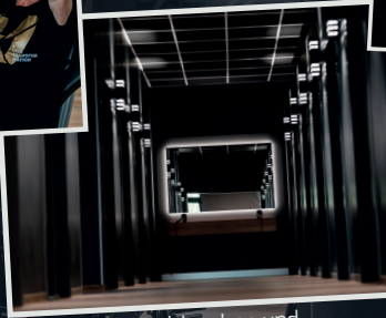
Einzelduschen und Einzelumkleiden