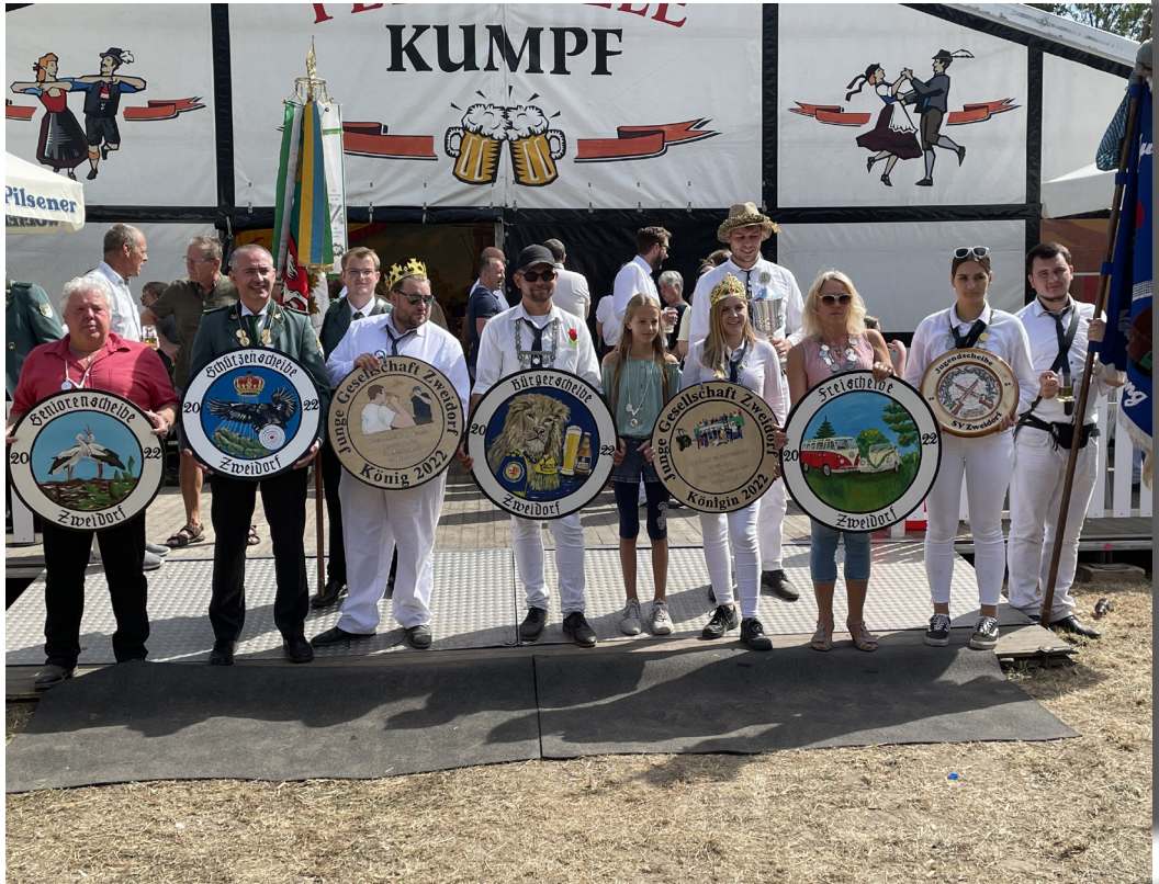
Die Majestäten aus 2022