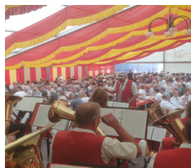
Volles Haus beim Frühstück!

Musikwünsche unter https://tebe-entertainment.de/vorabmusikwunsche